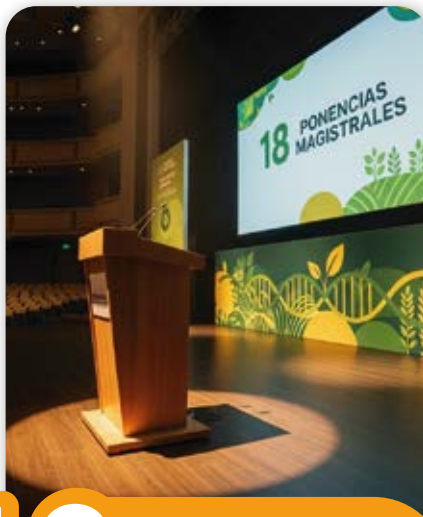
18 Ponencias Magistrales